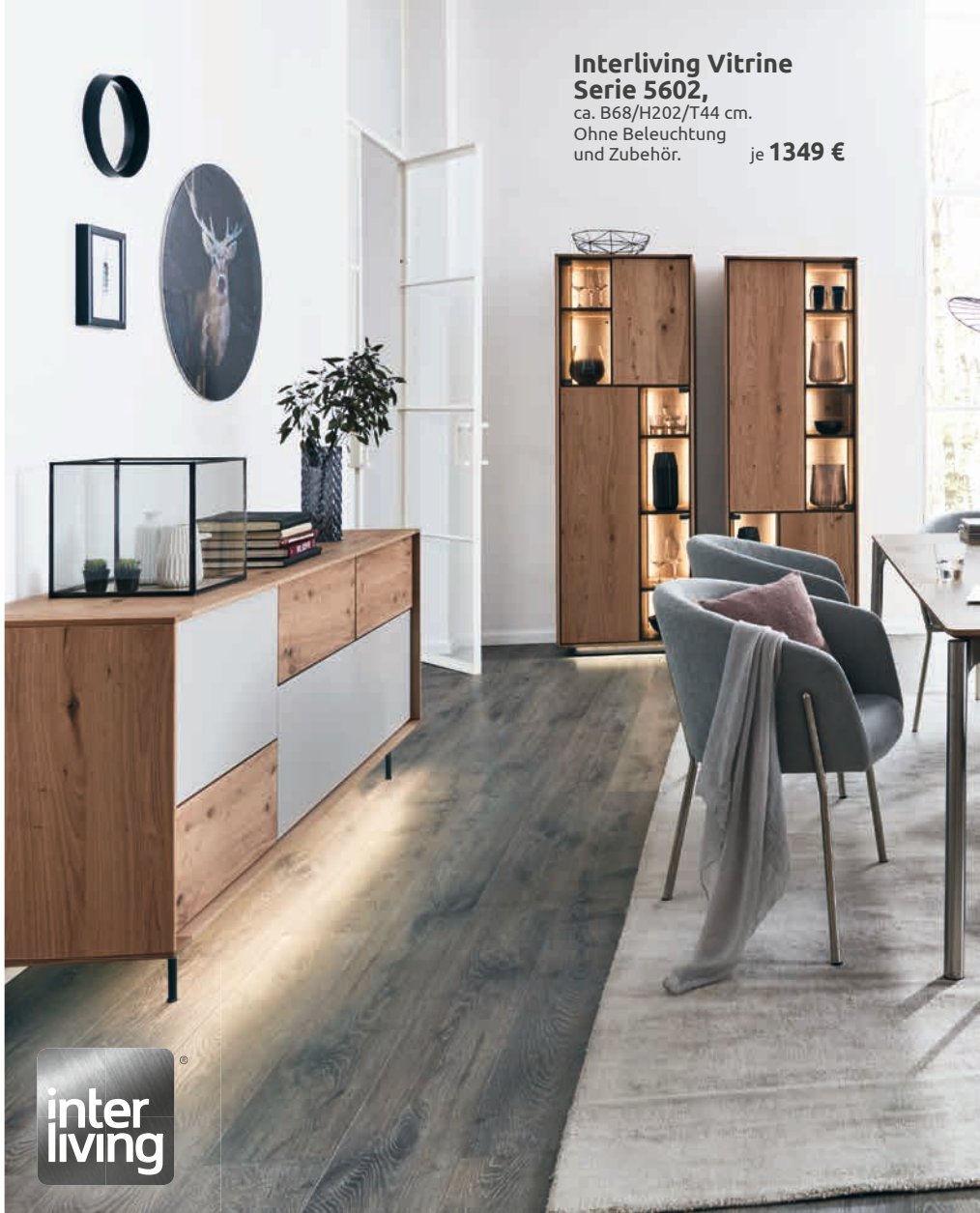
Interliving Vitrine Serie 5602, ca. B68/H202/T44 cm. Ohne Beleuchtung und Zubehör. je 1349 €