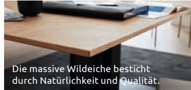
Die massive Wildeiche besticht durch Natürlichkeit und Qualität.